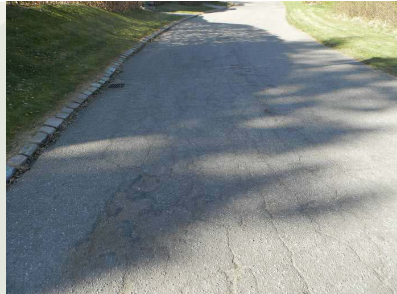
Revner i belægningen